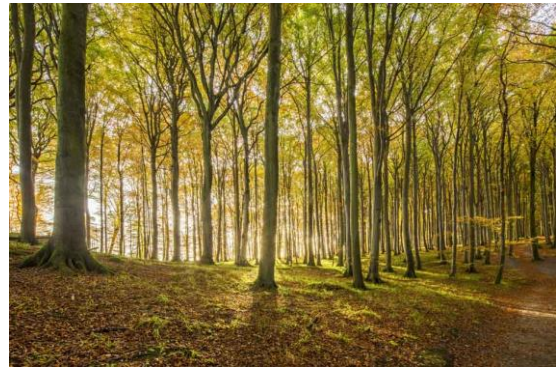
Description/Caption: Buchenwald im Nationalpark Jasmund ( UNESCO-Weltnaturerbe ) auf Rügen Province/State: Mecklenburg-Vorpommern Country: Deutschland

Bei Tieren und Pflanzen um die genaue Angabe der Rasse oder Art und möglichst um die lateinische Bezeichnung. Darüber hinaus ist es durchaus auch von Relevanz, wo das Tier oder die Pflanze fotografiert wurde (Zoo/botanischer Garten vs. Natur).