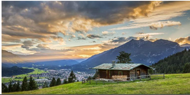
Description/Caption: Abendstimmung an der Eckenhütte am Wank gegen Kramer (1985m) mit Blick nach Garmisch-Partenkirchen Province/State: Bayern Country: Deutschland

Zudem bitten wir Sie, Eigennamen/Ortsangaben in Originalschreibweise (d.h. María statt Maria, León statt Leon, München statt Muenchen oder Munchen) anzugeben.