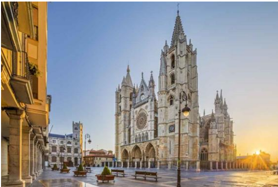
Description/Caption: Gotische Kathedrale Santa María de Regla von León am Jakobsweg City: León Province/State: Kastilien-León Country: Spanien

Bei bedeutenden Gebäuden wäre die Angabe des Baustils hilfreich, wie z.B. Antike, Romanik, Gotik, Renaissance, Barock, Klassizismus, Jugendstil etc.