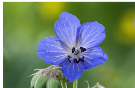
Description/Caption: Wiesenstorchenschnabel (Geranium pratense) , Schwäbische Alp Province/State: Baden-Württemberg Country: Deutschland